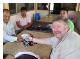
Spolek JHP škola